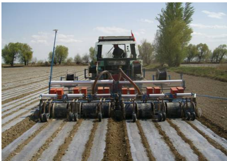
Рис. 1. Багатофункціональна сівалка 2 VMJ-12

Задля посіву кукурудзи з використанням інноваційних методів поливу Сінцзянська компанія “Кешень Лтд” з науково-технічного освоєння сільськогосподарського обладнання розробила посівні машини з функцією прокладки плівки та трубопроводів для систем крапельного зрошення, що значно зменшує кількість технологічних операцій, а отже, знижує витрати коштів та кількість шкідливих викидів CO 2 в атмосферу (рис. 1).