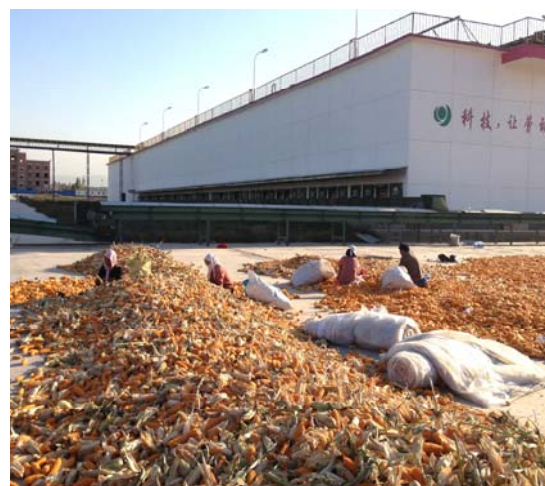
Рис. 3. Збір та переробка гібридної кукурудзи

Досвід науки і практики використання води в сільськогосподарському виробництві Сіньцзянської Корпорації КНР має вагомe значення для України, де водних ресурсів обмаль.