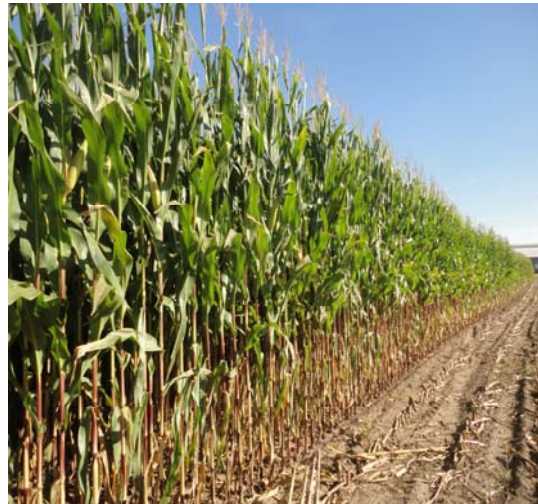
Рис. 2. Площа посіву кукурудзи з використанням крапельного поливу

печити чергування технологічної ширини міжрядь – 40 та 70 см. Після прокладання поливних ліній вони приєднуються до головних водопроводів (колекторів), а перед збиранням урожаю шланги для крапельного поливу прибирають з поля (рис. 2).